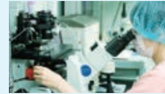
顕微授精はピエゾ ICSI で実施。

培養室は、患者様の大切な卵子や精子、そして受精卵(胚)をお預かりするクリニックの心臓部です。卵にやさしい最先端の機器や技術を用いることで、高い妊娠率を誇っています。