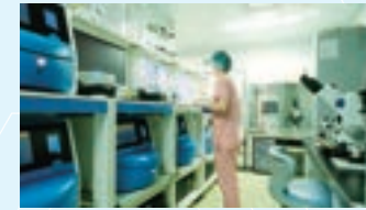
タイムラプスが5台もそろそろ 稀有な環境。